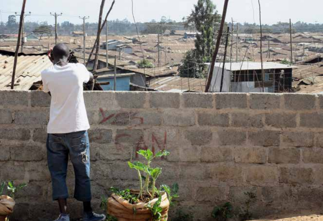
„Yes we can“: Optimistisches Graffiti an einer Mauer in Kibera/Nairobi, dem zweitgrößten Slum Afrikas.