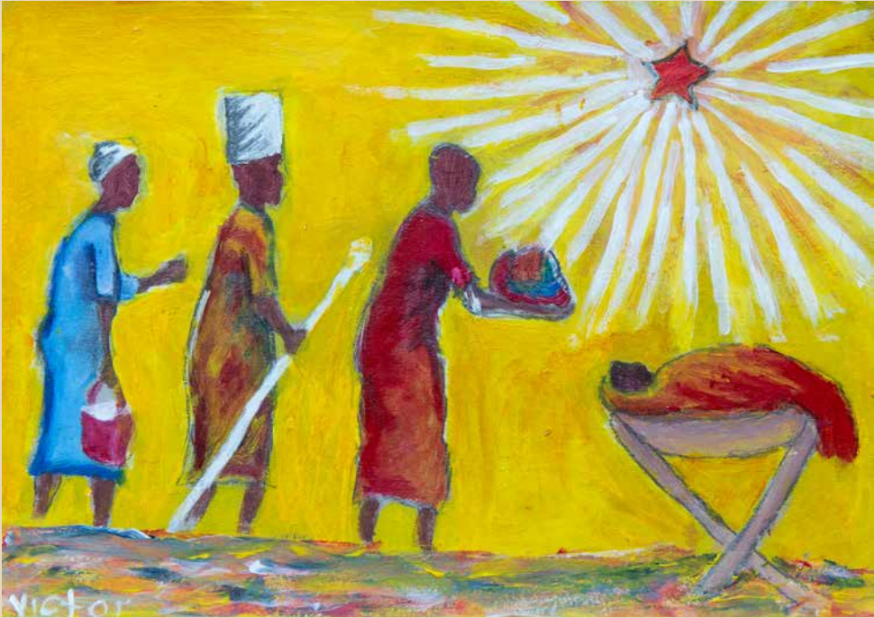
Erleuchtet vom Stern. Die Könige bringen ihre Gaben zur Krippe.