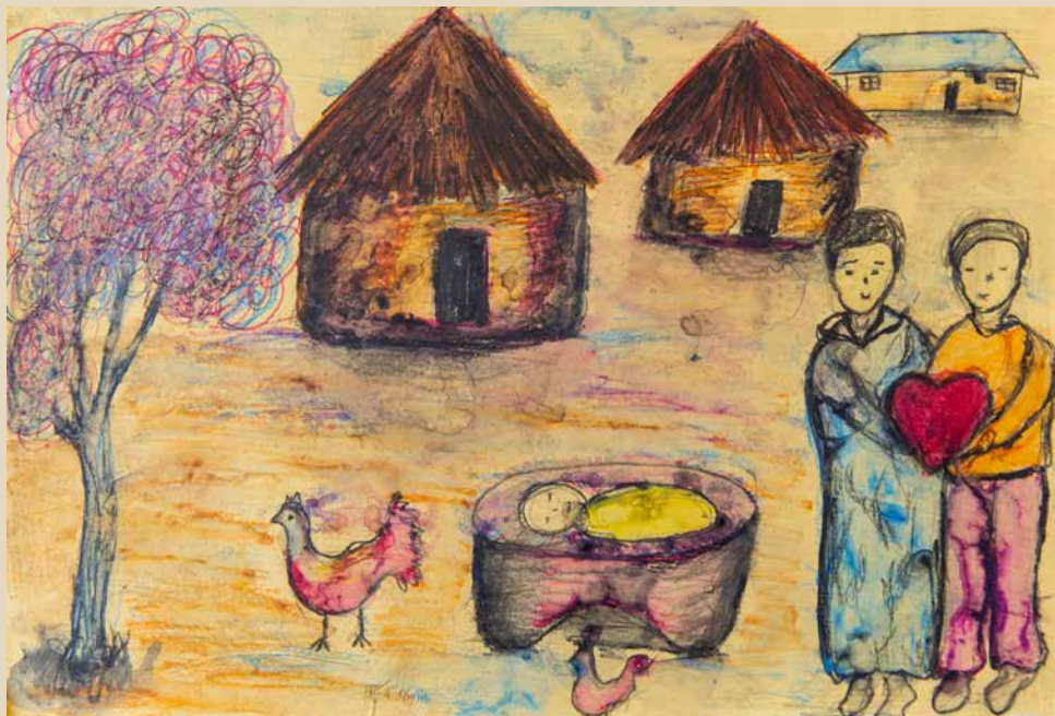
Das neue Kind im Korb hat ihr ganzes Herz gefangen.