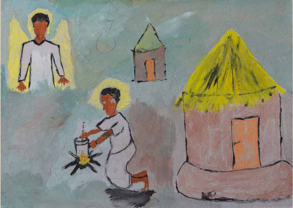
Verkündigung. Der Gruß des Engels erreicht Maria mitten im Alltag: Du bist voll der Gnade.