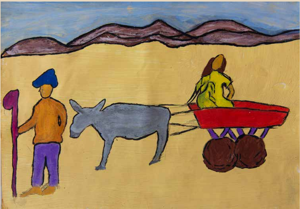
Nach Bethlehem durch die Wüste, Maria und Joseph unterwegs.