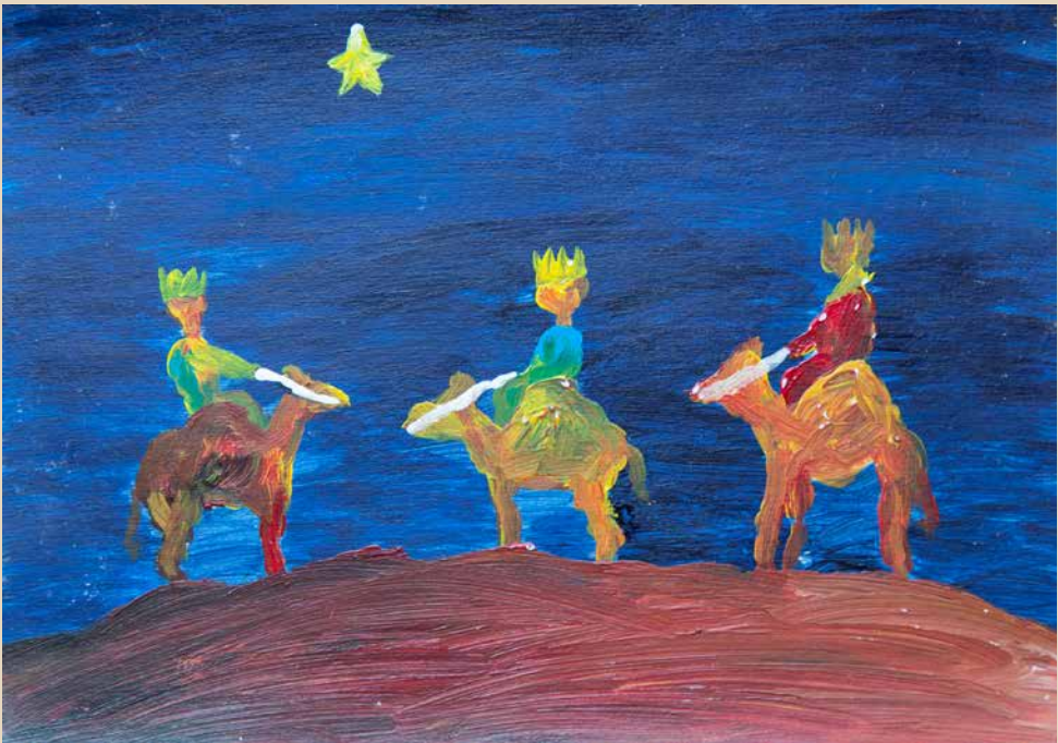
Und die Sehnsucht reitet mit ihnen durch die Nacht.